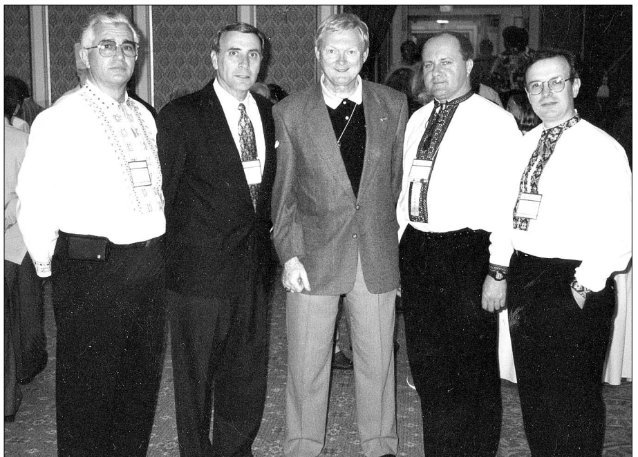
Зустріч з президентом НАКС США (CUNA) (другий зліва)